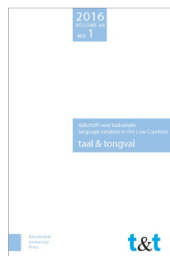
TAAL EN TONGVAL